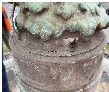
Afbeelding 4: Bevestiging van het standbeeld aan de sokkel

Vooraleer het standbeeld opnieuw geïnstalleerd wordt na de werken moet het hersteld worden: er zijn enkele breuken, blaasjes en schaafplekken. Er zijn experts geraadpleegd om de werken te plannen.