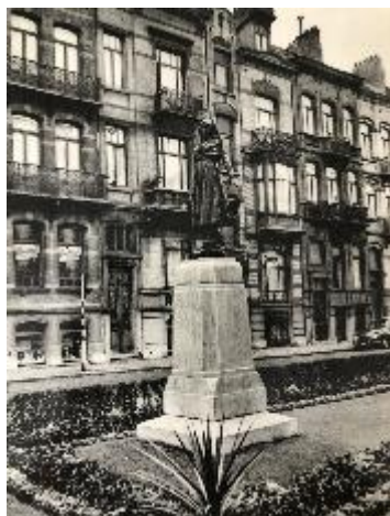
Afbeelding 4: Waterdraagster op een sokkel in de Parklaan