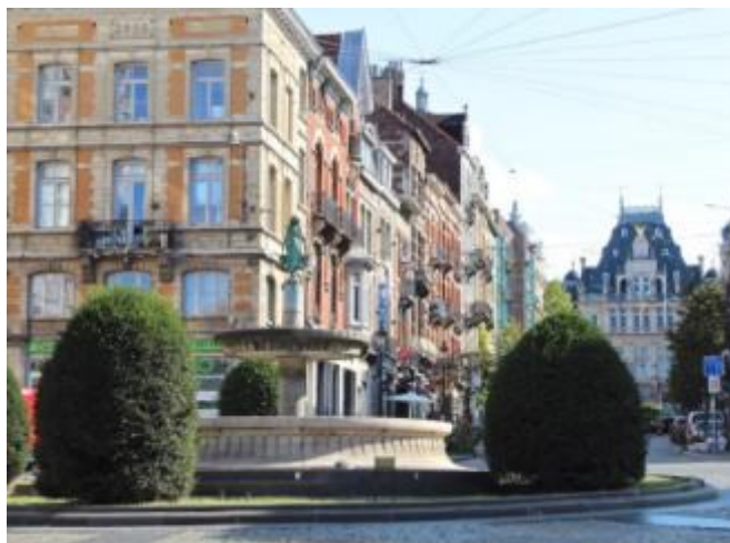
Figure 3 : Disposition sur la fontaine avant les travaux actuels