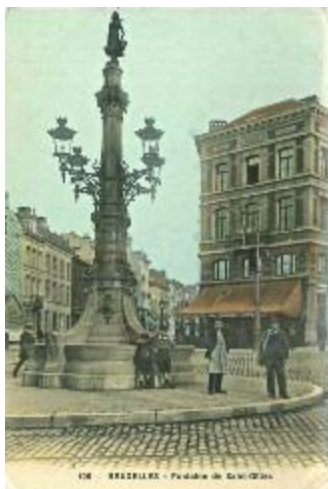
Figure 2 : Montage original de la Porteuse d'eau en 1898