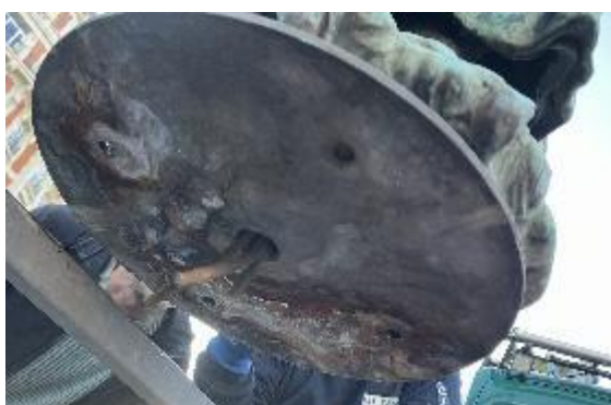
Figure 3 : Vue de dessous : trous de fixations

La copie a été réalisée en 1993 en bronze par la fonderie WYN basée à Hemiksem. Elle est fixée au fût par des boulons, recouverts d'une plaque en acier.