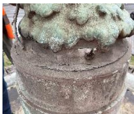
Figure 4 : Fixation de la statue au socle