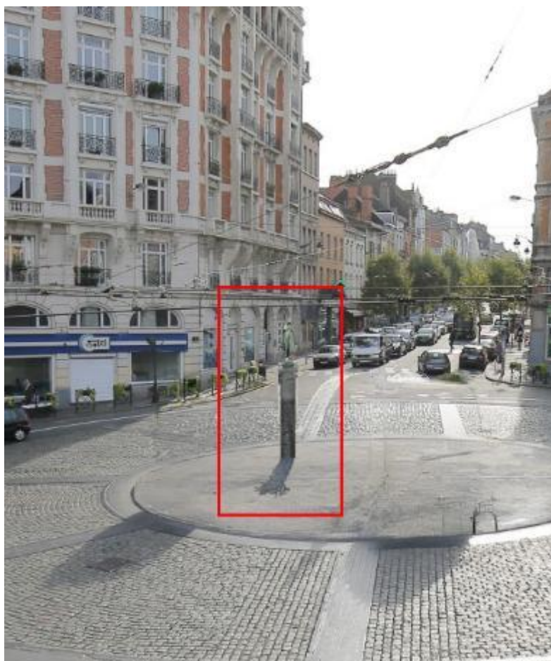
Figure 5 : Futur positionnement de la Porteuse d'eau, projection virtuelle dans l'axe de la chaussée de Waterloo (vers Faubourg) - © Commune de Saint-Gilles

Le positionnement futur de la statue est représenté dans l'encadré rouge :