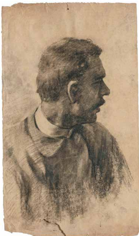
↑ © IRPA, 2020

Présentation des œuvres durant le Parcours d'Artistes les 11-12 et 18-19 avril 2026 à l'hôtel de ville.