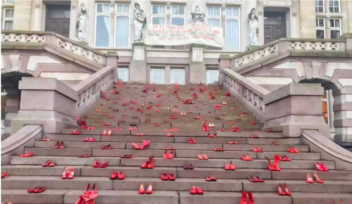
↑ Red Shoes, symbole de l'engagement contre les violences faites aux femmes

D epuis 1999, le 25 novembre marque la journée internationale de lutte pour l'élimination des violences à l'égard des femmes.