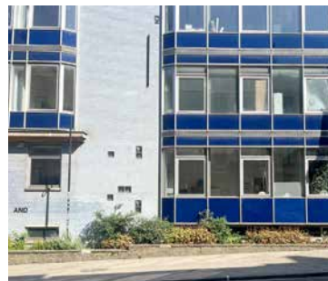
↑ Photo Kaatje Cusse © Peter Downsborough Works. Né en 1940 à New Brunswick (USA), Peter Downsborough est décédé en août 2024 à Bruxelles.

ET est une œuvre de Peter Downsborough, artiste de renommée internationale, réalisée à l'occasion du Parcours d'Artistes 2020 par la commune de Saint-Gilles et les Rencontres Saint-Gilloises pour la façade de l'école Nouvelle, 128B rue de l'Hôtel des Monnaies.