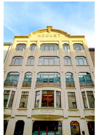
↑ Maison Hoguet

Ne manquez pas cette occasion unique de découvrir les merveilles cachées de Saint-Gilles et de célébrer l'architecture dans toute sa splendeur.