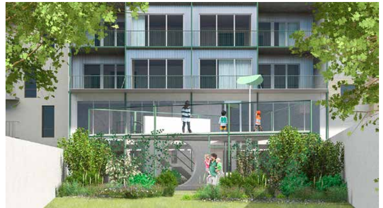
↑ Projection © bureaux Ledroit Pierret Polet Architectes et A Practice

B onne nouvelle pour les familles et les habitants du quartier du Midi : un nouveau projet mixte (conçu par les bureaux Ledroit Pierret Polet Architectes et A Practice) verra le jour rue de Mérode, aux numéros 97-103. Saint-Gilles, en collaboration avec citydev.brussels et avec le soutien du programme européen FEDER, y installera une nouvelle crèche communale néerlandophone comprenant 24 places et six logements spacieux. Cette nouvelle construction répond à deux enjeux urbains majeurs : pallier le manque de crèches et combler la demande croissante de logements dans le périmètre du quartier Midi. La crèche, répartie sur une superficie de 511 m 2 , comprendra deux étages et offrira un accueil de qualité pour les tout-petits saint-gillois. Quant aux logements, situés dans les étages supérieurs, ils compteront quatre appartements 2 chambres, un bureau