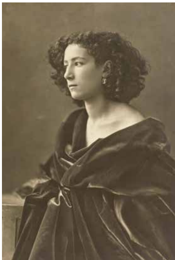
↑ Nadar, Sarah Bernhardt, 1864, à l'âge où elle a résidé à Saint-Gilles, avenue de la Toison d'Or.