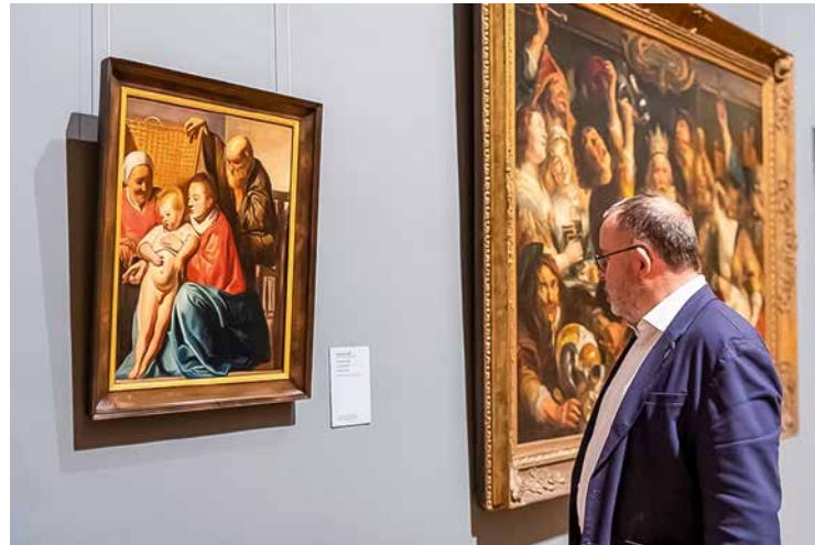
↑ La sainte famille, Jacques Jordaens