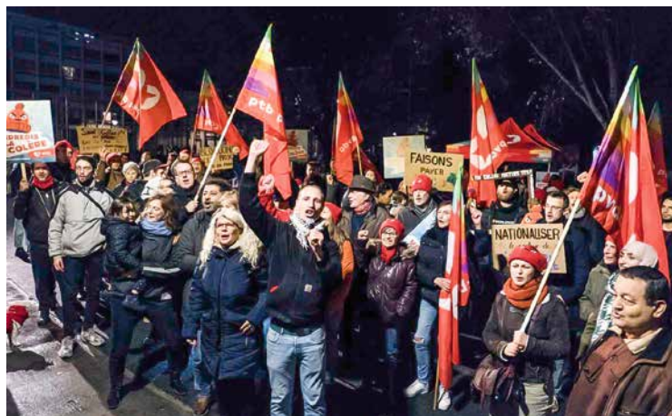
↑ « Le vendredi de la colère » organisé au square J. Franck en novembre

Mais c'est surtout à la source qu'il faut agir. Le gouvernement doit reprendre le contrôle, il doit arrêter de laisser les actionnaires d'Engie s'enrichir en appauvrissant la population. Comme dans d'autres pays, nous avons besoin d'un blocage des prix. C'est pour cela que nous allons à la rencontre des habitant·es avec notre pétition, notre plan alternatif et nos rassemblements.