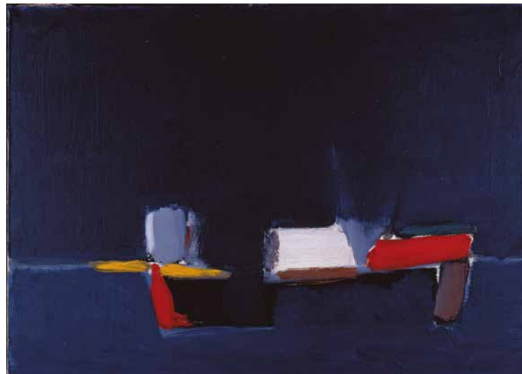
↑ Nicolas de Staël, Marine, huile sur toile, 1954.