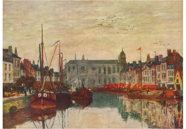
↑ Eugène Boudin, Canal de Bruxelles, quai aux briques, 1871.