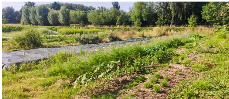
↑ Le maraîchage biologique du projet Biotiful

O utre son implication dans le projet de jardin fleuri, évoqué dans l'article précédent, le CPAS a pris d'autres initiatives sur le même thème: l'article 60§7 de la loi du 8 juillet 1976 organique des CPAS vise par exemple une forme d'aide de nature à permettre l'insertion socioprofessionnelle. Dans les faits, chaque travailleur et travailleuse en emploi d'insertion doit bénéficier d'un accompagnement formalisé par un « plan d'acquisition de compétences ». C'est dans ce cadre que différentes collaborations ont pu être mises en place notamment avec le projet Saintgilliculteurs, où trois travailleurs art.60 sont actuellement en poste, et le service communal des Espaces verts, qui accueille lui un art.60. Pour