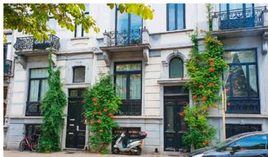
← Plantes grimpantes en façades

logie et du développement durable. Elle vient compléter harmonieusement le travail des autres services communaux présents dans l'espace public : urbanisme, espace public, espaces verts, développement durable... tout en étant à l'écoute des citoyens et habitants désireux de contribuer à la qualité des espaces publics par des dispositifs de végétalisation.