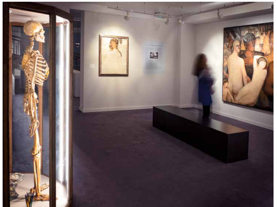
↑ Le musée Spitzner, qu'il découvre à la foire du Midi avec ses squelettes et autres éléments anatomiques, sera pour le peintre une riche source d'inspiration.