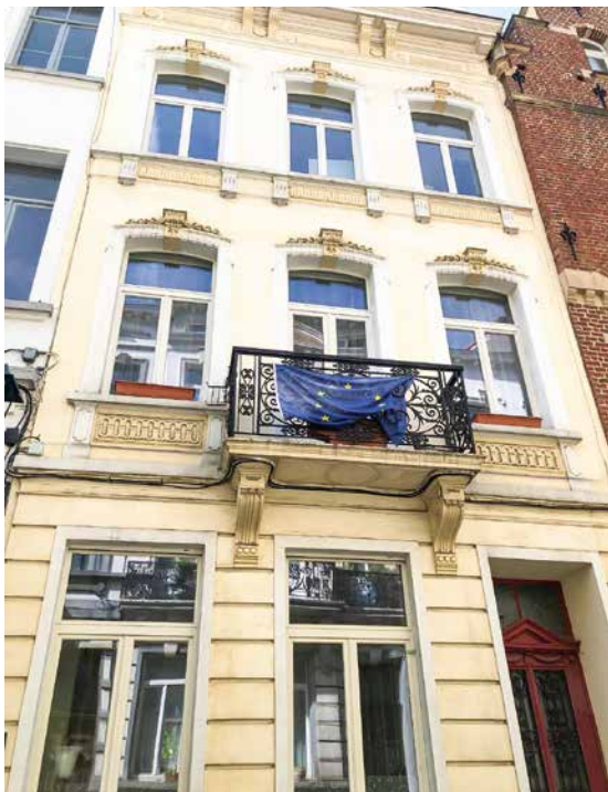
↑ 19 rue d'Écosse où, se partageant avec le 15, Paul Delvaux a habité près de la moitié de sa vie.