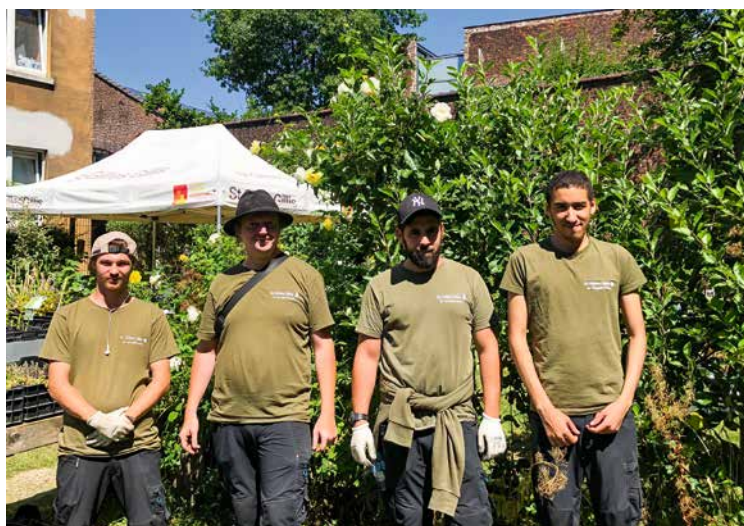
↑ L'équipe des Saintgilliculteurs

Concrètement, la Cellule végétalisation urbaine accompagne les projets tels que le placement de plantes grimpantes en façades, les plantations en pieds d'arbres, les potagers collectifs... À ce jour, 627 plantes grimpantes ont déjà été installées par ses soins et 22 viendront grossir ce chiffre d'ici la fin de cette année, presque donc 650 ! Vous croiserez sûrement l'un des Saintgilliculteurs, les agents communaux chargés des plantations pour la CVU, au cours de l'un de vos déplacements. Ils sont équipés d'un vélo cargo électrique pour transporter les plantes et tout le nécessaire à l'embellissement de la commune.