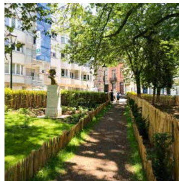
↑ Square Bouvier

laissées en friche dans les parcs ou des prairies fleuries sont semées afin de favoriser la biodiversité (cimetière, place Morichar, square Bouvier...). Les fosses des arbres sont agrandies et des parcelles sont déminéralisées par les services communaux (place des deux bancs, placette rue Bosquet) ou lors de chantiers participatifs en collaboration avec l'asbl Less béton (rue de Bosnie).